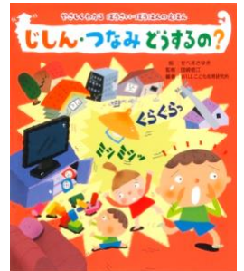
向井先生が紹介された絵本 ～じしん・つなみ どうするの?～

4/15(木)の3時間目に地震の避難訓練を行いました。前日の事前学習から積極的に意見を出し合って防災について議論する姿から、子どもたちの安全に対する意識の高さを感じました。私からは、2018年6月に起きた最大震度6弱の大阪北部地震の話をしました。前任校のある京都南部でも震度5弱で、地震が起きた8時前はちょうど登校時間でした。学校に到着し廊下や階段にいる子、スクールバスやまだ電車に乗っている子など、ばらばらの状態だったため、保護者や同じ路線の学校に通う卒業生など、様々な連絡手段を駆使しての児童の所在と安否を確認したのを今でも鮮明に覚えています。電車が止まっていたため、登校していた児童は保護者に迎えに来てもらい、これまでに毎年行っていた災害を想定した引渡し訓練の成果を感じました。この時の様子を7名の子どもたちに伝えると、質問を交えながらとても真剣な様子で聞いていました。