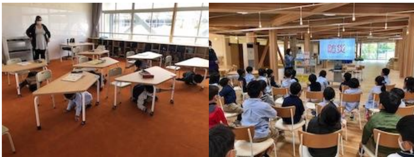
15 日（木）の避難訓練。身を守る行動や振り返りなどから子どもたちの意識の高さを感じました。

また国語（図書）の時間以外にも、授業の進捗状況や子どもたちの様子を見ながら、10 分でも 15 分でもクラスで Alexandria に行って読書をする時間を作っています。気持ちを落ち着けて本をじっくり読むことは、今の子どもたちにはとても重要なことです。また知識を増やすだけでなく、静かに本を読みながらヨギボーやハンモックのある Learning Commons での過ごし方のルールも「習得」しています。SOLAN の 3 年生は、毎日 50 ページ読むことを目標にしています。ご自宅や通学でも読書に取り組めるよう、保護者の皆さまからもお声がけいただければ幸いです。