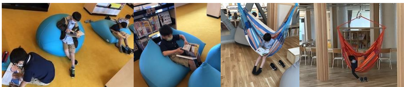
Alexandria と Learning Central での読書。SOLAN らしい個人の時間です。