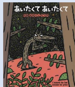
「あいたくてあいたくて」 作絵:みやにしたつや

これからも こくごとしよ 国語図書 のじかんで しゅうちゅうして しずかに ほんをよむ れんしゅうを していきたいと おもいます。