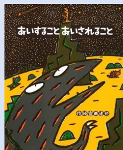
「あいすることあいされること」 作絵:みやにしたつや