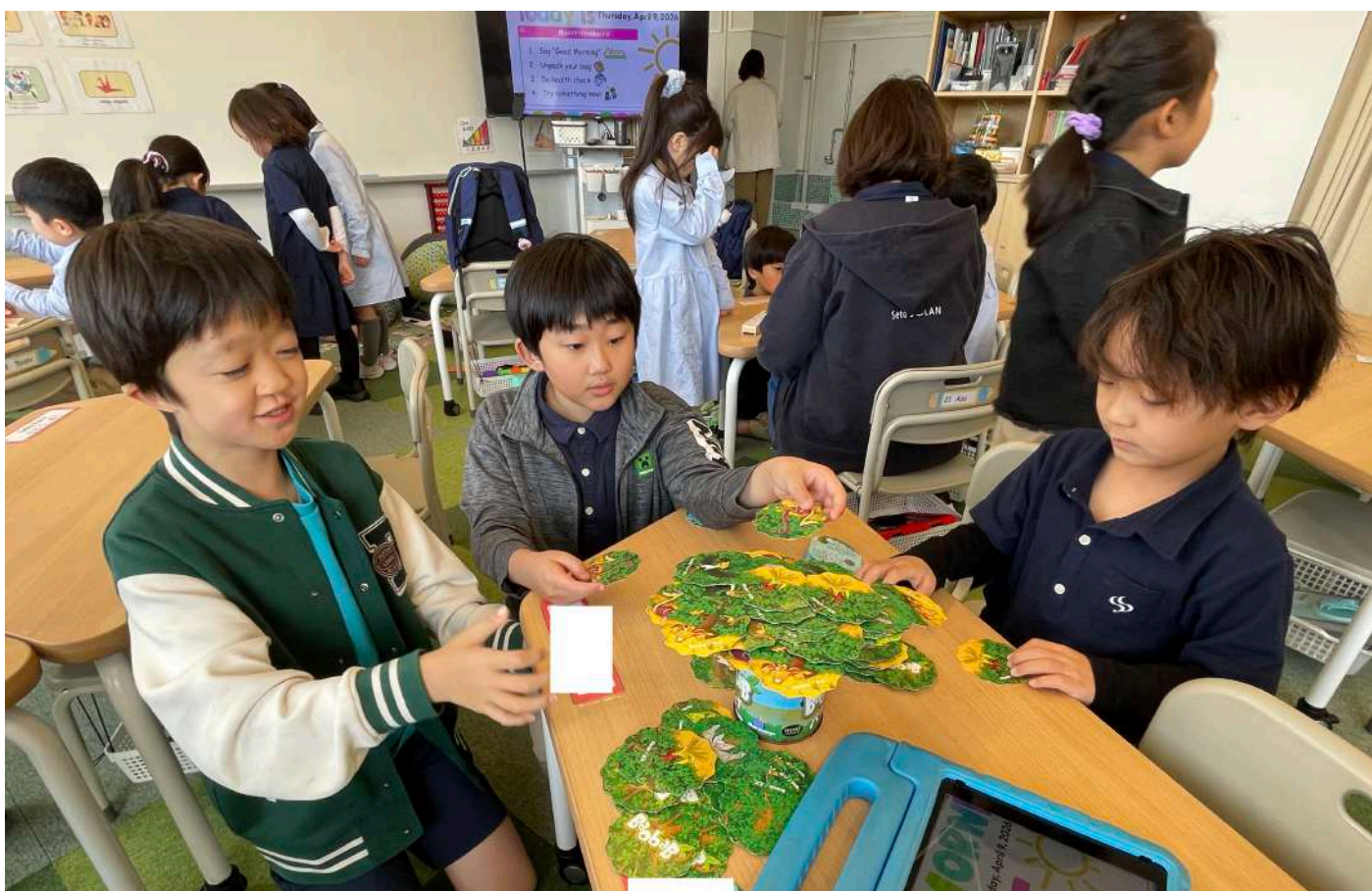
1年生生活サポート