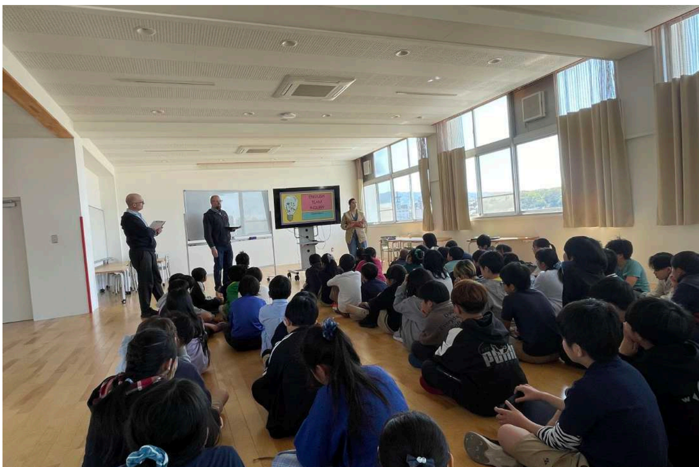
English Project オリエンテーション