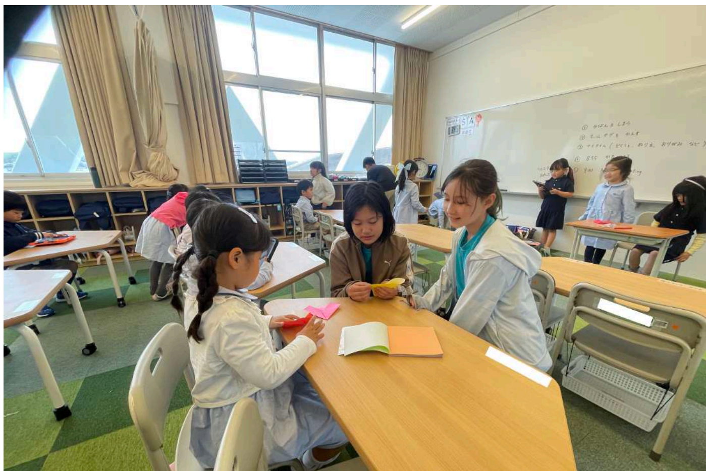
1年生 生活サポート