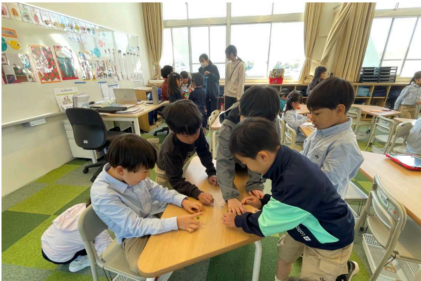
1年生 生活サポート