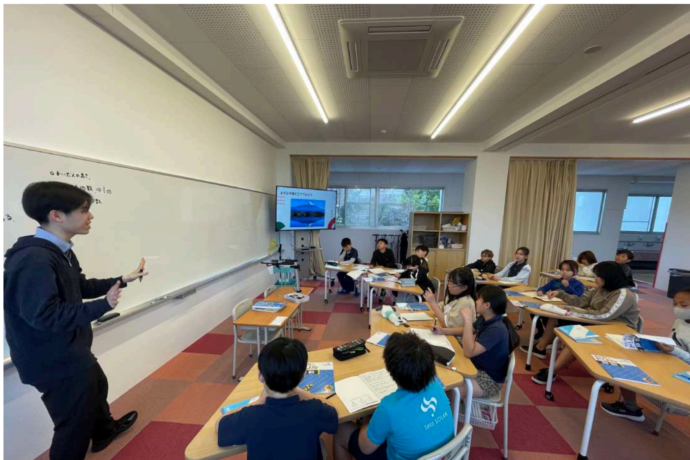
5-3 算数オリエンテーション