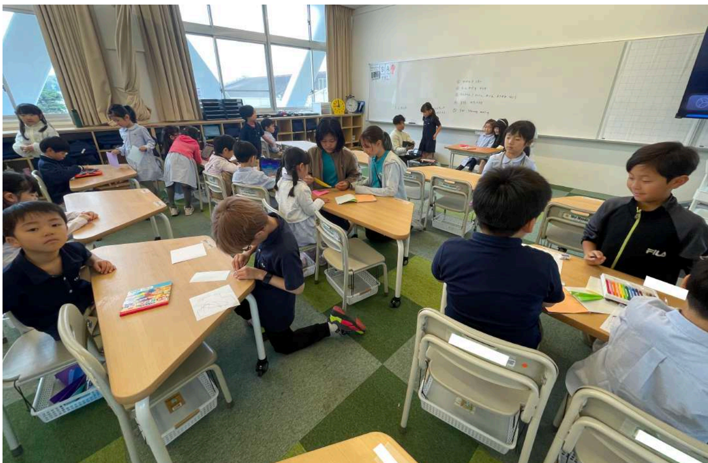
1年生サポート 5年生がんばってます！