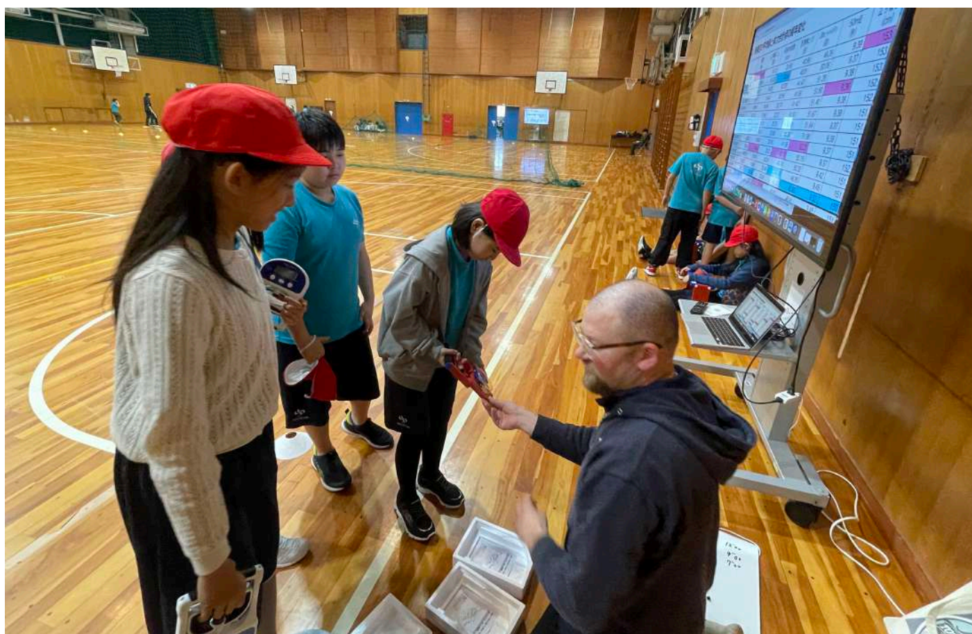
5-2 はじめての体育授業