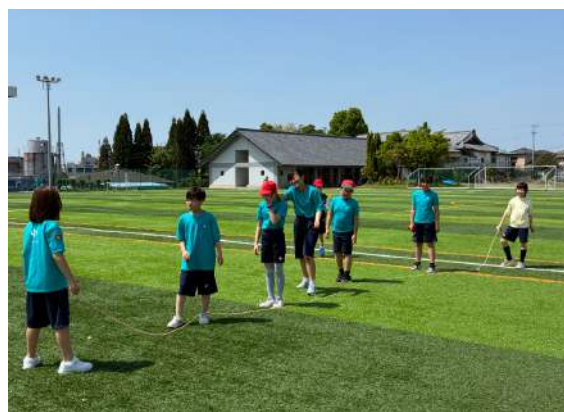
走り幅跳びの待ち時間に大縄跳び